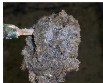
Nid de chenilles processionnaires du chêne

→ Lien vers le document d'information relatif à la processionnaire du chêne SANTÉ DES FORÊTS