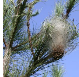
Nid de chenille processionnaire du pin

→ Lien vers le document d'information relatif à la processionnaire du pin SANTE DES FORETS